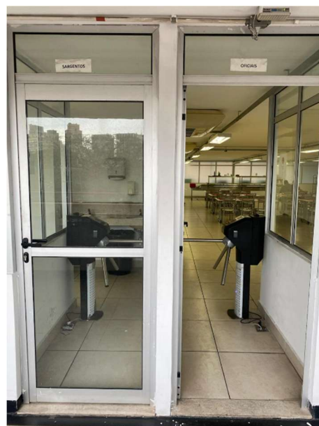
Refeitório de Subtenentes e Sargentos/Refeitório de Oficiais.