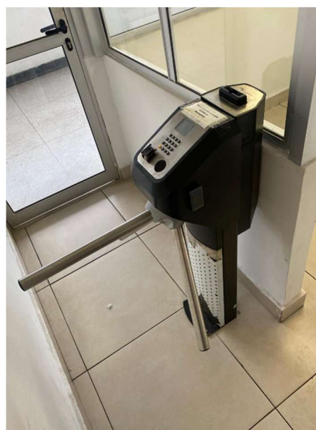
Entrada do refeitório: vista interna.

6.3. A Contratada deverá providenciar ainda, as condições necessárias para a