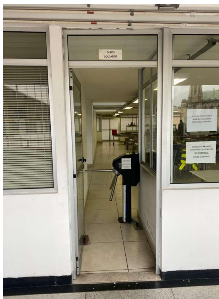
Refeitório de Cabos e Soldados.

6.2. Os equipamentos serão instalados em cada uma das entradas que dá acesso ao interior dos refeitórios de Oficiais, Subtenentes/Sargentos e de Cabos/Soldados: